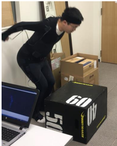
ラグビーのトレーニングにてボックス上をジャンプで乗り降りする際の実際の計測風景

2020 年東京五輪も控え、国内スポーツ分野においてデータ解析の需要が増している中、東洋大学総合情報学部様では、スポーツ中の選手の挙動やフォームなどを数値化してデータを取得し、その後のコーチングや指導に役立てる研究が行われております。