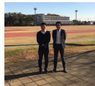
東洋大学 川越キャンパス内風景

「本研究室では、スポーツ選手の心理を研究しております。コーチと選手のコミュニケーションをより円滑に、また、確実にしてゆくため、定量的な数値を用いた指導が行われております。これまで、光学式の全身モーションキャプチャを使用しておりましたが、マーカが計測中にはがれてしまうなどの課題を抱えておりました。スーツタイプである ZMP 社の『全身モーションキャプチャ ZMP® IMU-Z Body Motion』を使用することにより、生徒の練習中の挙動計測などが行いやすくなりました。現在は同校ラグビー部を中心に使用していますが、フォーム改善などにも使用ができそうで、同校野球部での使用も検討しています。計測中に身体の接触がない状態であれば本製品の使用が可能となり、挙動計測が可能のため、今後はゴルフなどいろいろなスポーツ分野での活用も