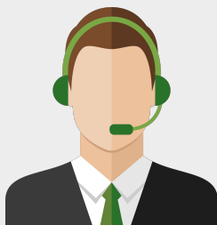
カスタマーサクセス

広告運用者コーチング、広告アカウント保守、e-Learning永続解放など、教育コンテンツ受講後のカスタマーサクセスで、広告運用者をサポートし、広告運用のPDCAを適切に回せる環境を作る。