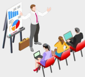
広告運用者コーチング

また、広告運用の現場で起きる不明点をクリアにし、スムーズに広告運用できるようにサポート。