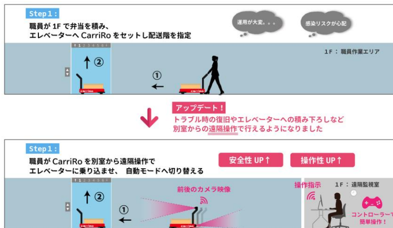
別室からの CarriRo®遠隔操作例

本機能は、物流支援ロボット CarriRo® AD+を遠隔管理クラウドシステム ROBO-HI®(ロボハイ)経由で操作できる機能です。CarriRo®のハンドル部に設置したカメラからの画像で、常に CarriRo®の周囲の状況を把握することができ、また画面を見ながらコントローラーを用いての操作や、自律移動モードへの切り替えができる仕組みとなります。