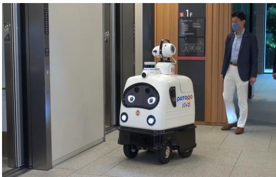
エレベーターボタンの消毒