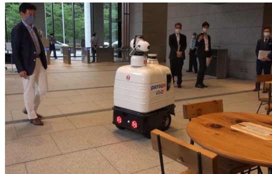
テーブルと椅子の消毒