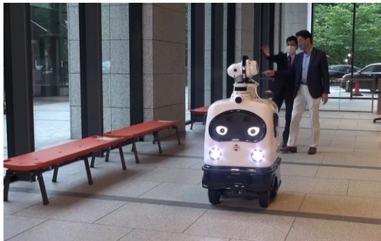
来客用ベンチの消毒

動画では、人がよく触れる設備として、ベンチ、テーブルと椅子、そしてエレベーターのボタンなどを順次消毒する様子をご覧になれます。自律移動および消毒液散布器の自動制御により、消毒対象とする設備の設置エリア以外は散布をしないなど、効率よく消毒ができる可能性を示しています。