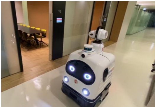
会議室のドアハンドルの消毒