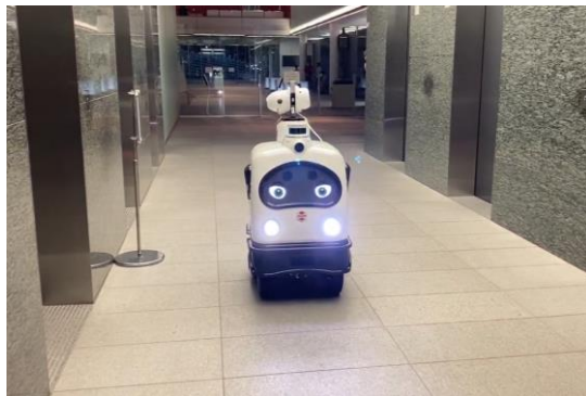
エレベーターボタンの消毒