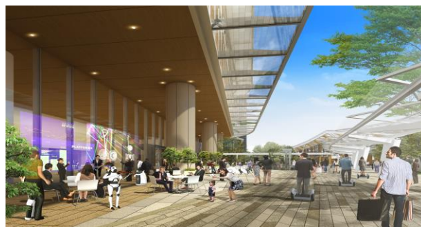
街におけるロボットとの共存イメージ