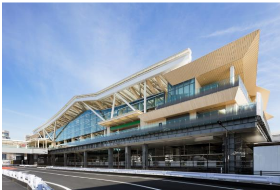
高輪ゲートウェイ駅

https://www.jreast.co.jp/press/2020/20200707_ho02.pdf