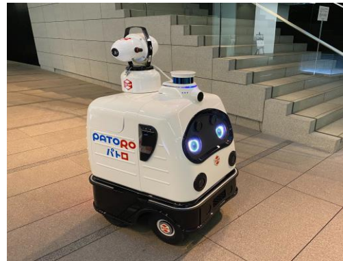
無人警備・消毒ロボ「パトロ」