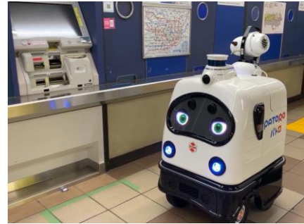
券売機横の荷物置き場を消毒