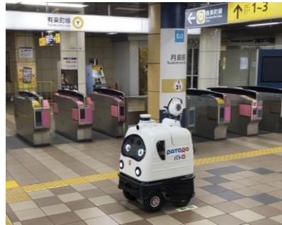
月島駅構内の走行