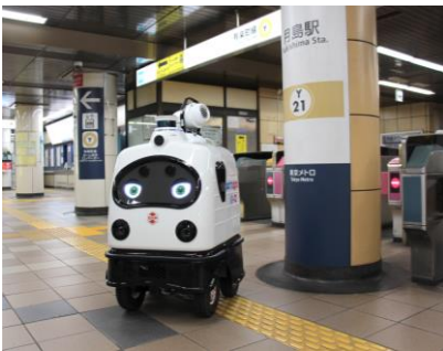
月島駅改札口前にて

動画では、月島駅構内や人がよく触れる設備として券売機横の荷物置き場、化粧室の手すりなどを順次消毒する様子をご覧になれます。自律移動および消毒液散布器の自動制御により、消毒対象とする設備の設置エリア以外は散布をしないなど、効率よく消毒できる可能性を示しています。また、離れた場所にモニターを設置しインターネット経由でロボットに実装されたカメラの様子等を確認できる遠隔監視・制御用のクラウドシステム「ROBO-HI®(ロボハイ)」についてもご紹介しました。