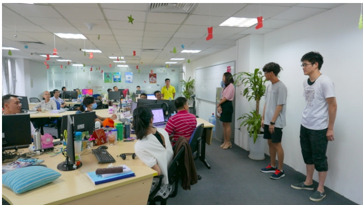
<コウエル アジアのカンパニーツアースタート>