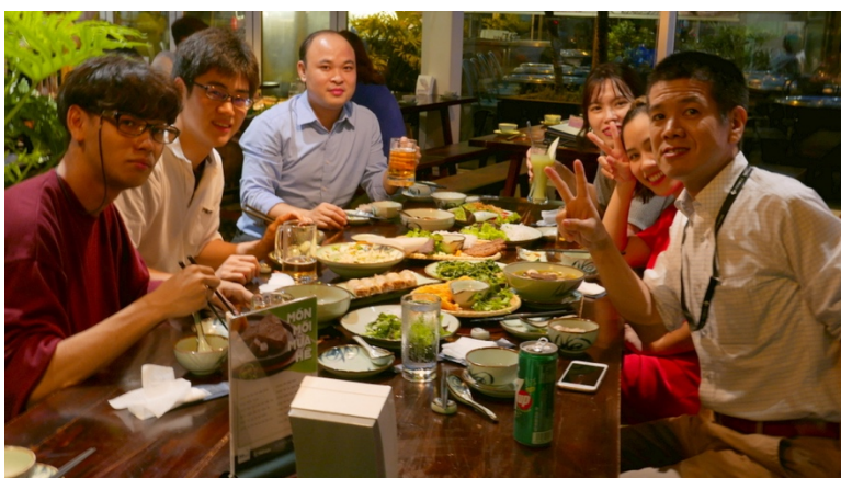
<仕事が終わった後のコミュニケーション ～ベトナム風の歓迎会～>