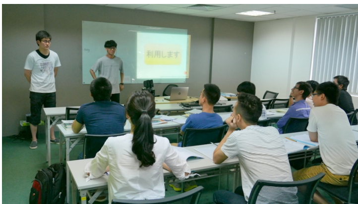
<日本語教育クラスに参加 ～日本人と交流したい現地社員と交流～>