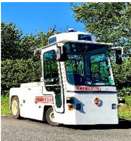
ZMP製CarriRo® Tractor 25T