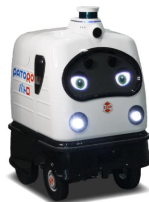
無人警備・消毒ロボ「パトロ」

無人警備・消毒ロボ「パトロ」は、これまで東京メトロの駅構内、名古屋の商業地下街 ESCA といった公共スペースや、竹中工務店東京本社ロビーなどさまざまな場所で実証を行ってまいりました。「パトロ」は、自動走行による警備と並行し、新型コロナウイルス対策として、駅や商業施設などの無人消毒での活用も目指してまいります。