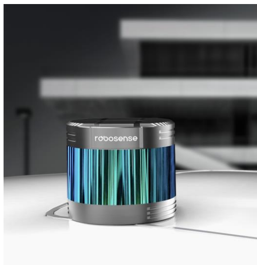
Robosense 社製 RS-Ruby Lite

【最大測定距離 230m 自動運転・ADAS 用 3D-LiDAR RS-Ruby Lite 製品ページ】