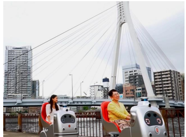
2台が前後に並んで移動