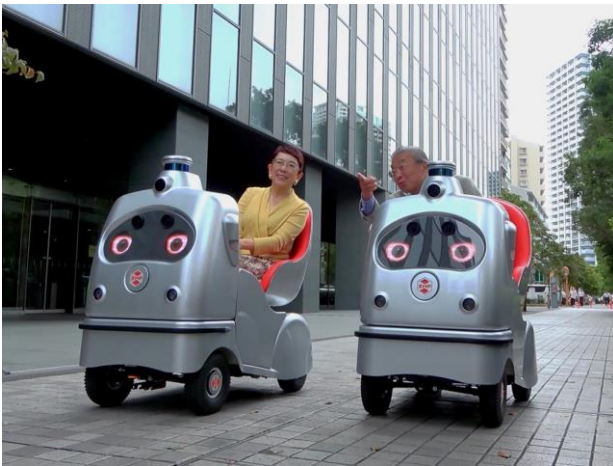
2台が横に並んで移動

本ツアーを通じて、安心・安全に大切な方と同じ経験を共有できる新しい移動サービスを提供いたします。