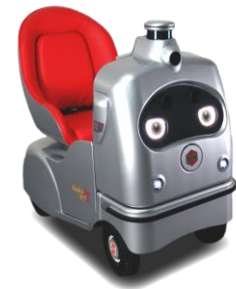
一人乗りロボ「ラクロ」

ラクロは、笑顔やウィンクなどの豊かな表情と、声による挨拶やお願いといったコミュニケーションを周りの人と取りながら自動走行する一人乗り車いすロボットです。本体に設置された複数のセンサーやカメラにより周囲を把握、監視し障害物を回避しながら安全に停止できる自動走行により目的地まで安心して確実な移動を提供します。時速6km/h以下で走行する電動車椅子として分類されるため公道での走行ができます。また、公益財団法人テクノエイド協会が運営する福祉用具情報システム(TAIS)にも登録されています。