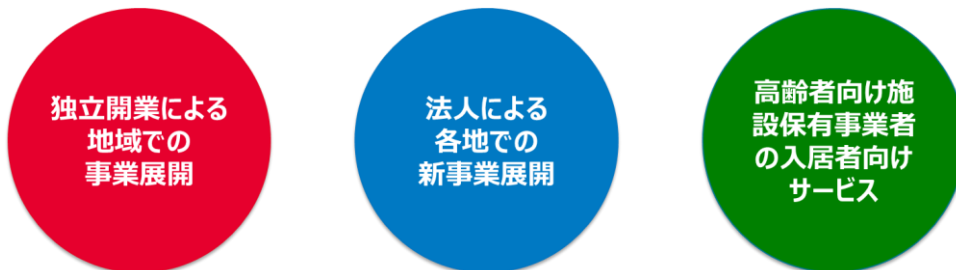
フランチャイズオーナーの対象(例)