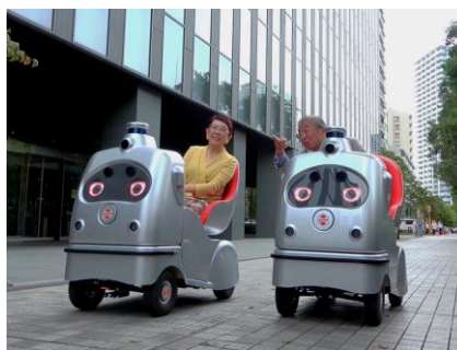
左:ラクロシェアリング拠点「佃 BASE」、中央:ラクロ予約用アプリ、右:佃でのシェアリングの利用イメージ

ラクロ紹介 HP: https://www.zmp.co.jp/products/lrb/rakuro